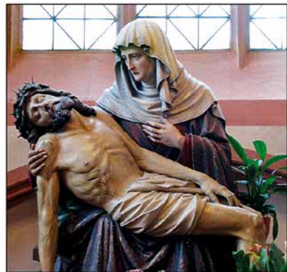
St. Bartholomäus, Frankfurt

Allen Spendern ein herzliches Vergelt's Gott!